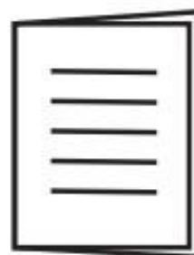
Guía de usuario